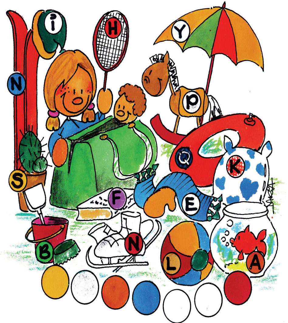
Bild: Daria Broda, www.knollmaennchen.de In: Pfarrbriefservice.de

Die kleine Pauline fährt mit ihrer Familie in den Sommerurlaub. Wohin? Das finden neugierige junge Gemeindebriefleserinnen und -leser heraus. Wenn ihr genau hinschaut und überlegt, welche Dinge Pauline im Sommerurlaub NICHT braucht. Die Buchstaben an den Gegenständen, die sie nicht mitnehmen soll, ergeben das Urlaubsziel. Die Grafikerin Daria Broda hat eine Hilfe eingebaut: die Hintergrundfarben der Buchstaben. Sie unterstützen Euch bei der richtigen Zuordnung.